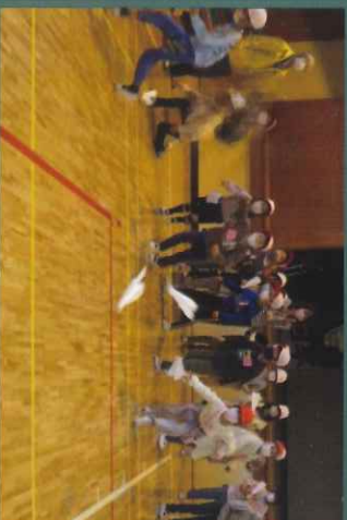
(小学校昔あそびの会)