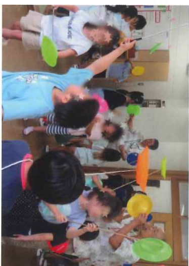
放課後児童クラブ(ぐらんぱと遊ぼう)