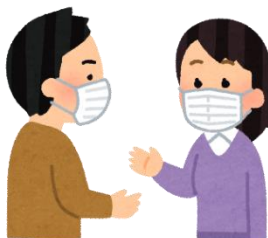
2. マスクをつけよう