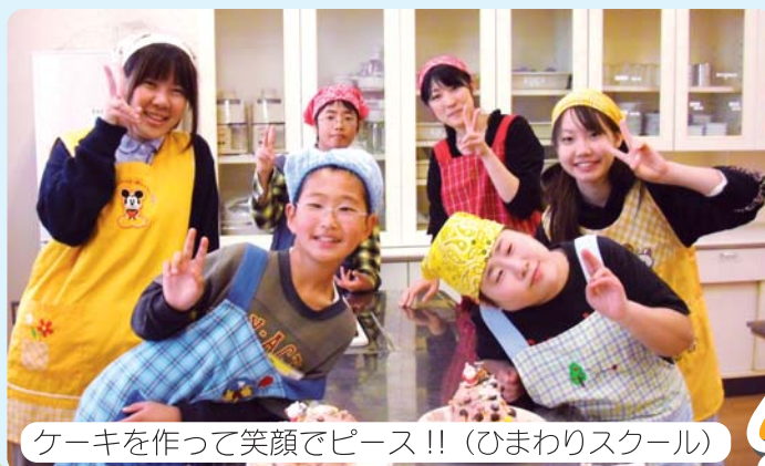
ケーキを作って笑顔でピース!! (ひまわりスクール)