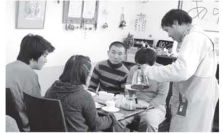
NPO 法人エールあさか 障害のある方の接客マナー講習