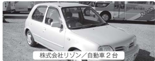
株式会社リゾン/自動車 2 台