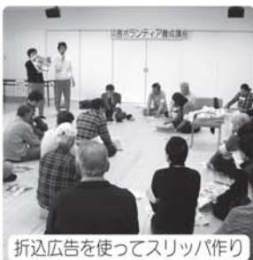
折込広告を使ってスリッパ作り

阪神・淡路大震災をはじめとする災害時において、日頃から培った地域活動(共助)によりスムーズな支援活動が行えたという教訓があります。当会では、今後もこのような地域づくりを応援していきます。