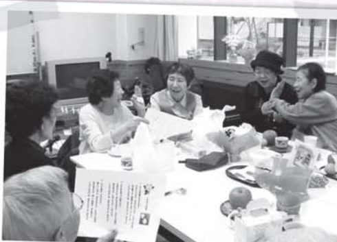
懐かしい歌を歌いながら、昔話に花を咲かせています。