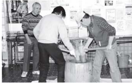
交流サロンみちくさ 新年餅つき会（西朝霞公民館）