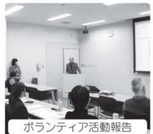
ボランティア活動報告