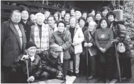
老人会食会・かぼちゃの会 年末おたのしみ会

みなさまの善意により集められた募金は、一人暮らし高齢者などのお宅をボランティアの協力により清掃する「ホームクリーニング事業」や老人会食、ふれあい・いきいきサロンのほか、地域住民の福祉活動への助成金として、朝霞市の福祉向上のために活用させていただきました。