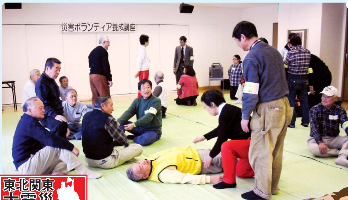
災害ボランティア養成講座