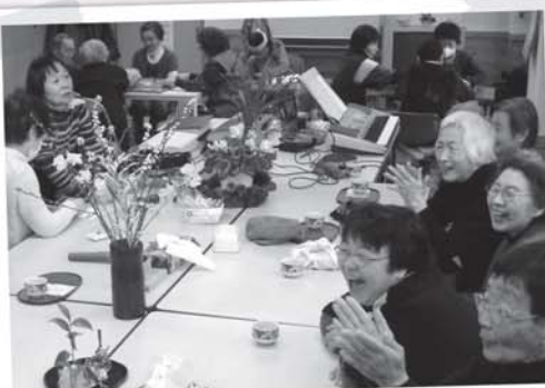
みんなで“気まま”に楽しい時間を過ごしています。