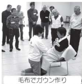
毛布でガウン作り

※この事業は、市民のみなさまからいただいた社協会員会費及び日赤社員社資で実施しました。