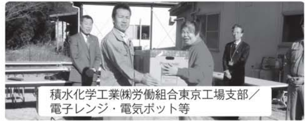
積水化学工業(株)労働組合東京工場支部/ 電子レンジ・電気ポット等