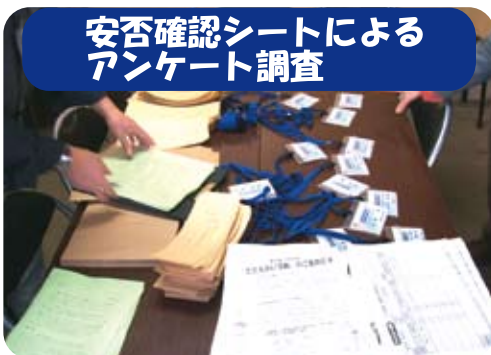
安否確認シートによるアンケート調査

朝霞市社会福祉協議会では、朝霞市地域福祉活動計画で『誰もが住み慣れた地域で安心していきいきと暮らせる福祉のまちづくり』の実現を目指し、地域の方と一緒に『災害時