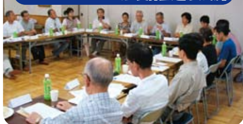
自分のまちを良くするために、町内会(役員・班長)が一体となって協議しています!