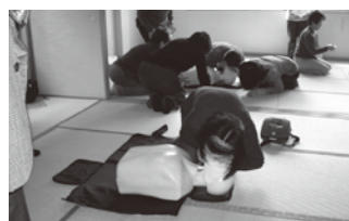
(命をつなぐリレー講習会)

☎: 048(486)2485【直通】 ☎: 048(486)2480 Eメール: mail@asaka-vc.net