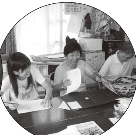
認定NPO法人メイあさかセンター