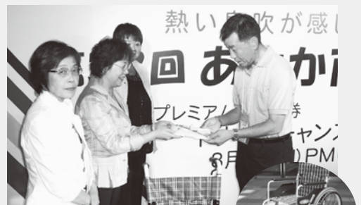
朝霞市商工会女性部 のみなさま