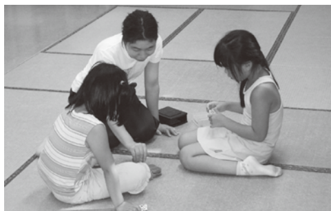
(体験プログラム・放課後児童クラブ)