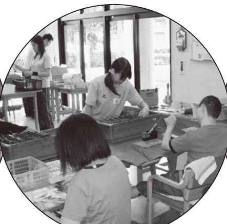
はあとぴあ知的障害者通所授産施設