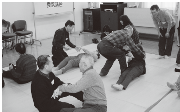
(災害ボランティア養成講座)