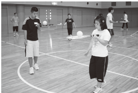
(知的障害者スポーツレクリエーション)