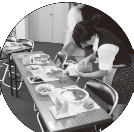
老人会食ボランティアグループ