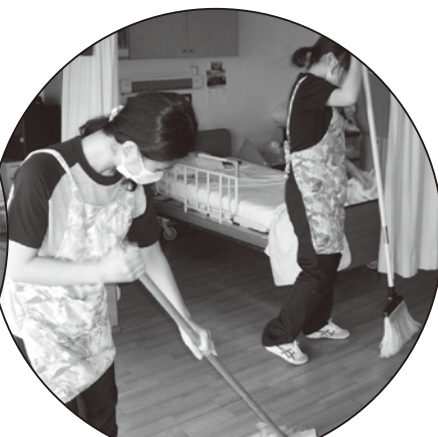
特別養護老人ホーム 朝光苑

今年度も、さまざまな施設・団体の皆様に、ボランティアの受入れや事業の企画についてご協力いただき、プログラムを実施しました。ご協力いただいた施設・団体の皆様、誠にありがとうございました!!