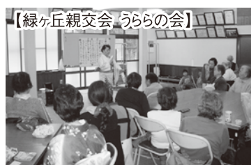
【緑ヶ丘親交会・うらの会】

▶ふれあい・いきいきサロンをはじめ、小地域を単位とする住民同士のささえあい活動の推進・支援を行っています。