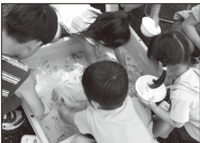
身を乗り出して小魚を追いかけていました。