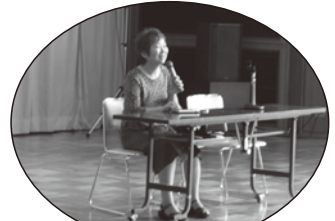
視覚に障害のある方のお話 (NPO法人 障害者も地域で共に・ コーヒータム)