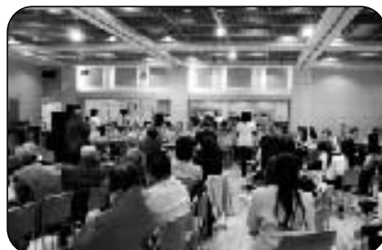
みんなで音楽祭にも参加しました♪