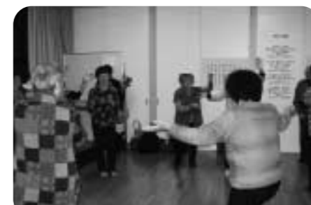
楽しく踊って身も心も健康に!