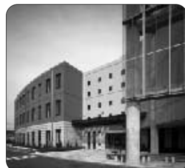
朝霞市総合福祉センター はあとびあ

市民のみなさまが安心して楽しくご利用できる施設を目指し、職員一同がんばります。みなさまのお越しを心よりお待ちしております。