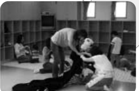
子どもも親もサロンで仲間づくり♪

「ふれあい・いきいきサロン」って何? ふれあい・いきいきサロンは、人との会話や外出の機会 のあまりない高齢者や障害のある方、小さなお子さんがい るお母さんなど、身近な地域で暮らす住民どうしが集まり、 お茶飲みやおしゃべりなどを楽しみながら「仲間づくり・ 生きがいづくり」を進める身近な地域の福祉活動です。 <お問い合わせ先>朝霞市社会福祉協議会 地域福祉係 ☎ 048 (486) 2485