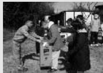
◆積水化学工業(株)積水化学労働組合 空気清浄機寄贈