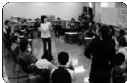
みんなで一緒に“ワン・ツー・スリー”！