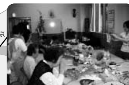
小物や季節の飾りを作っています。