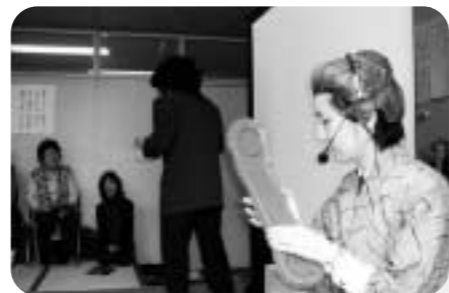
振り込め詐欺に遭わないように、警察官による楽しい寸劇で学びました。

場所：膝折団地第1集会場 日時：第2・4月曜日 午後2時~午後4時 参加者：膝折団地周辺の方 参加費：月100円