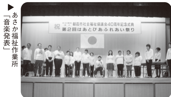
「あさか福祉作業所 音楽発表」

また同時に「はあとびあふれあい祭り」が開催され、餅つきや模擬店、参加各団体の自主製品の販売が行なわれました。アリーナでは、メイあさかセンターによる合唱や演奏、スーパーイコリーダンスによる華麗なるダンス、朝霞太鼓による迫力ある演舞を披露していただきました。