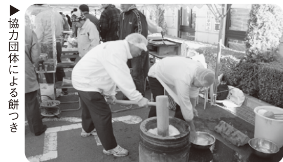
「協力団体による餅つき」