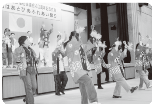
「知的障害者通所授産施設 「鳴子踊り」