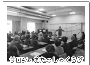
サロン・おたっしゃくらぶ