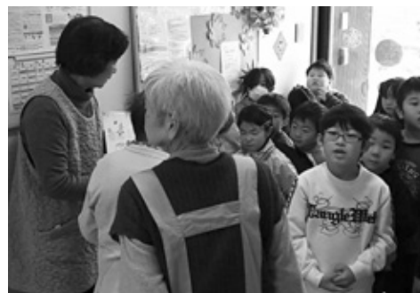
施設間の交流の様子