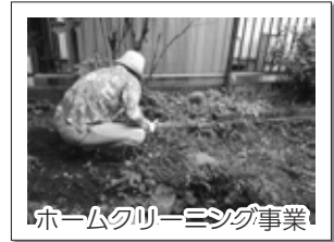
ホームクリーニング事業

みなさまの善意により集められた募金は、「ホームクリーニング事業」や「老人会食」、「ふれあい・いきいきサロン」のほか、地域住民の福祉活動への助成金として、朝霞市の福祉向上のために活用させていただきました。