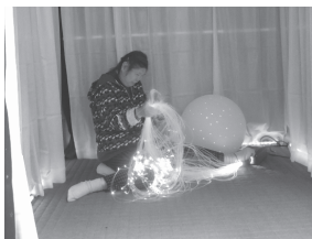
あさか福祉作業所