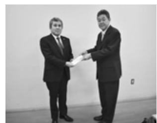
朝霞地区遊技業防犯協会