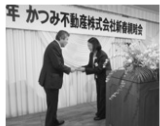
かつみ不動産株式会社