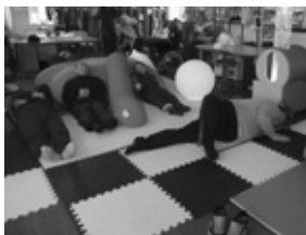
はあとびあ福祉作業所