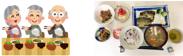
月に1回、高齢者へ手作りの昼食を提供

ボランティアスタッフが参加者たちに月に一度電話連絡。安否確認と様子伺いをしています。