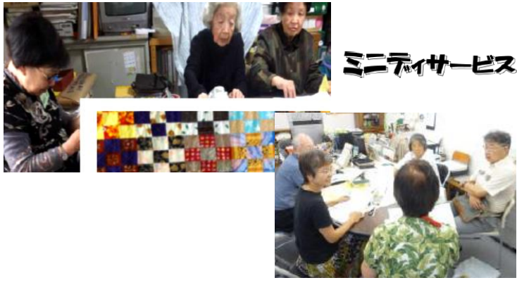
ミニデイサービス

ミニデイサービスの利用者の自宅にパッチワークのパーツをお届け。シニアの英会話クラスの方へは、ホームワークを郵送して、指先を使ったり脳トレで介護予防！